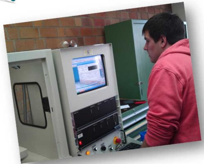
CNC Fräsen des Schlüsselanhängers